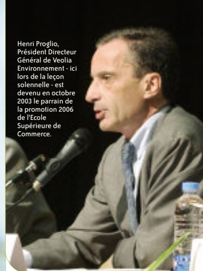
Henri Proglio, Président Directeur Général de Veolia Environnement - ici lors de la leçon solennelle - est devenu en octobre 2003 le parrain de la promotion 2006 de l'École Supérieure de Commerce.