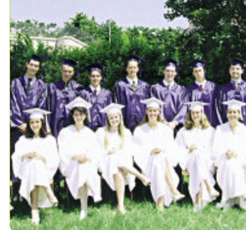
25 nationalités sont représentées à l'International School of Nice.

L'ISN est la seule école internationale de la Région PACA et une des rares en France à posséder la double accréditation internationale : European Council of International Schools (ECIS) d'origine britannique et le Middle States Association (MSA), nord-américaine, qui